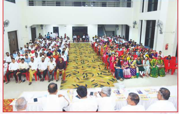
संस्थेच्या २३व्या वार्षिक सर्वसाधारण सभेस उपस्थित सभासद बंधु-भगिनी.