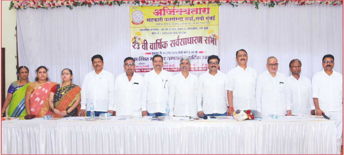
संस्थेच्या २३व्या वार्षिक सर्वसाधारण सभेप्रसंगी व्यासपीठावर उपस्थित संचालक मंडळ व मान्यवर.